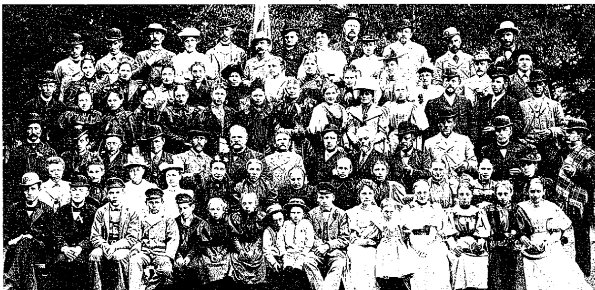
Deltagere i skovturen 1893.

hinanden. Det fortælles: »Et enkelt sted var gruekedlen brygget fuld af punch, og stemningen blev så stor-slået, at hjemvejen syntes dobbelt så lang. En enkelt deltager kom først hjem otte dage efter, men det turde være l...«