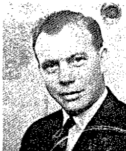
Anthon Berg 1955-1958 3