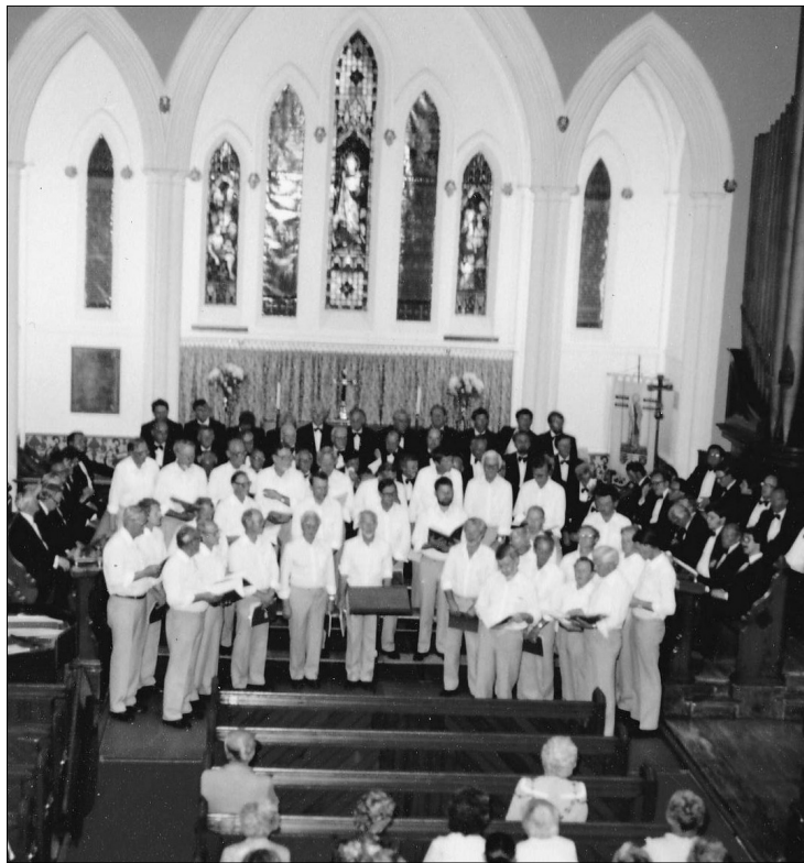
Sommeren 1983 - koret i skjortetærmer i den katolske kirke i Wales

Torsdag den 22. december holdt 'radiokoret', som man kaldte den korgruppe som i julemåneden medvirkede i radioprogrammet Morgen- nisserne, ekstraøve i Østervang- kirken. Lille- juleaften tidligt om morgenen mødte gruppen i Radiohuset.