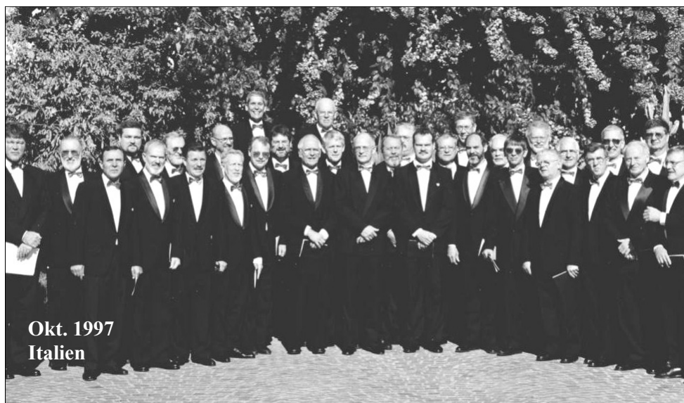
Okt. 1997 Italien