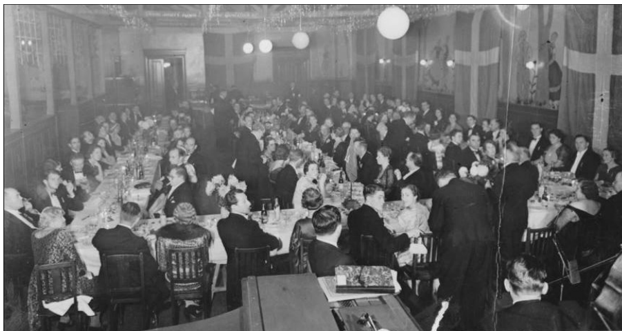
Se, dette er en stiftelsesfest der vil noget - et forsigtigt skøn siger omkring 125 deltagere. Anledningen var ganske vist også lidt særlig, nemlig foreningens 55 års jubilæum. Tid: 30. november 1938, sted: Jerbanehotellet i Glostrup (nedrevet 1969 for at gøre plads til Glostrup Centret). 'Den Gyl-denblonde' underholdt og Max Skalkas Orkester spillede til middagen og dansen bagefter.

smørrebrød. I protokollen står der: »Der blev taget skyldigt hensyn til både det kulinariske og det sanglige«. HT-koret og GS mødtes af og til; det var et velrenommeret mandskor under det daværende Hovedstadens Trafikselskab, oprindelig Sporvejsfunktionærernes Sangforening. Det er nu for længst opløst.