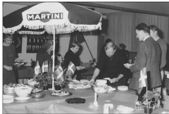
Fra receptionen på 100-års dagen

Der er ingen tvivl om at det var en jubilæumskoncert af høj kvalitet – det tyder alting på, og sådan husker de sangere, der var med for 25 år siden, den også. Af et notat, skrevet