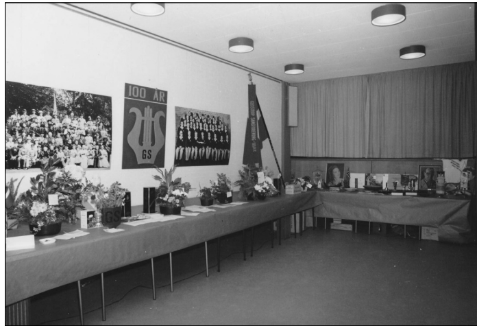
Endnu to billeder fra 100-års jubilæumsreceptionen