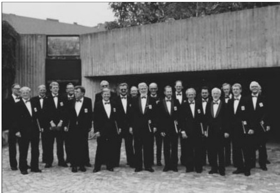
Foran hovedindgangen til Tempelkirken i Helsingfors, august 1986

Søndag den 7. september deltog koret sammen med flere andre kor, i promenadekoncerten på Københavns Rådhus. Den følgende onsdag aften mødtes alle der havde været med i Finland - man mindedes den gode tur og kiggede billeder.