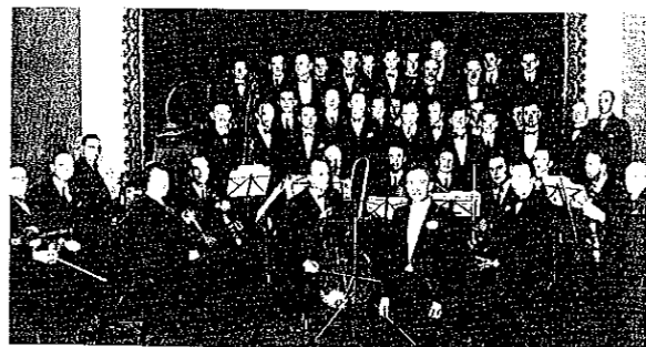
Taastrup Sangforening (Billedet er fra 1945)

Den tilstundne Oslostur blev nøje diskuteret.