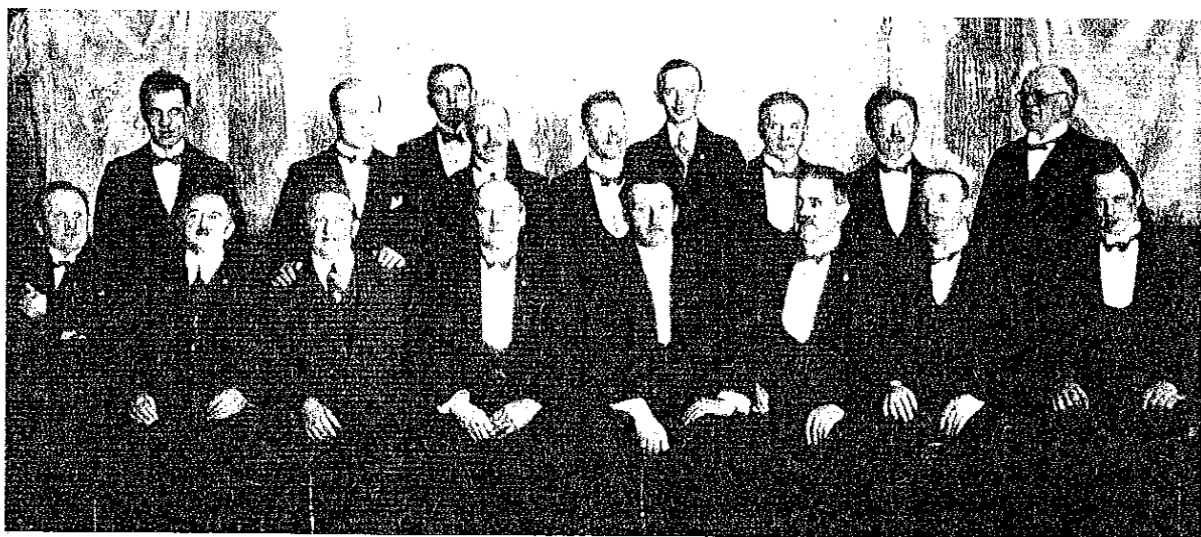
En del sangere 1927